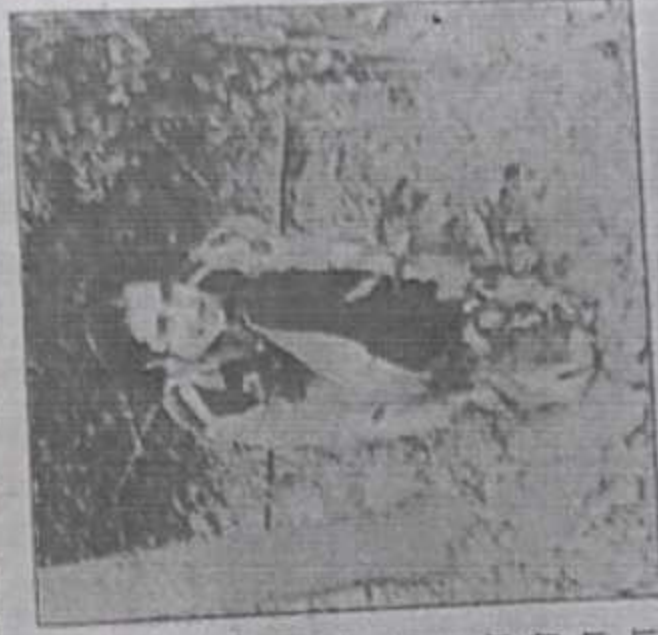
पौधारोपण करती हुई छात्राएं