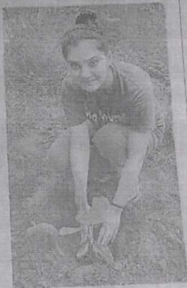
हरित हरियाणा अभियान के तहत घर पर केले का पौधा लगाती छात्रा •